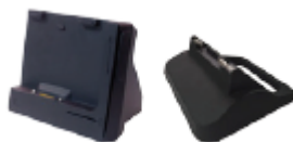
Cradle de Bureau